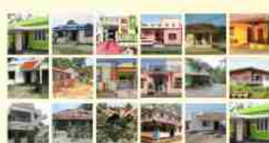
Mogallur Village Houses